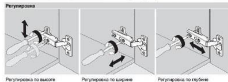
Регулировка по высоте