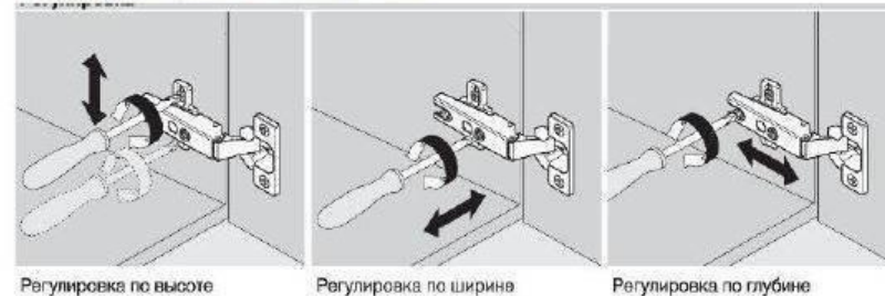
Регулировка по высоте